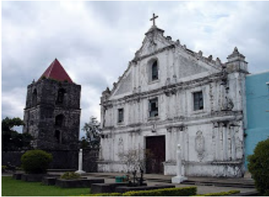
Iglesia de Guiguan